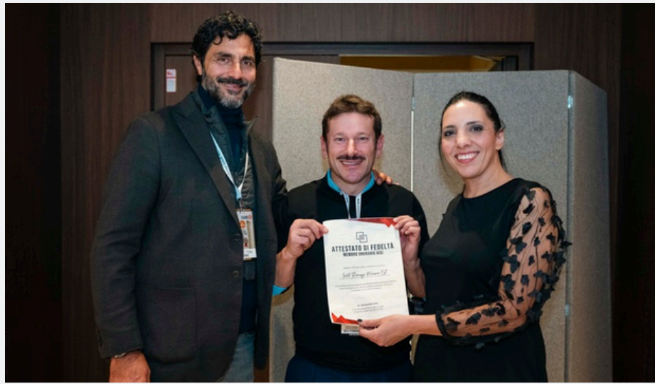
Giovanni Tronchin, Self Storage Milano Est